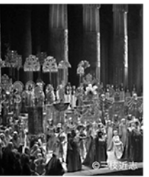
合唱 新国立劇場合唱団*