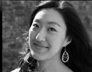
蝶々夫人 ヴィットリア・イェオ*