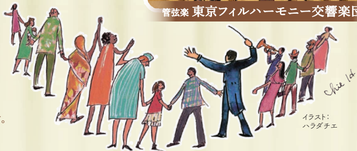
イラスト: ハラダチエ

※やむを得ない事情により、出演者・曲目・曲順等が変更となる場合があります。 ※未就学児のご入場はお断りしております。 ※公演中止の場合を除き、お求めいただいたチケットの払戻・変更等はいたしません。