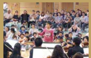
举办活动将管弦乐的现场演奏带给全国各地的孩子们 Bringing live orchestra music to children all over Japan