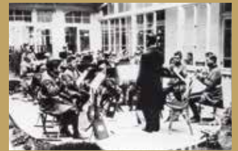
东京爱乐交响乐团的前身,1911年在名古屋成立的吴服店少年乐队 "Ito Kimono" Boys Band, predecessor of the Tokyo Philharmonic Orchestra, was founded in Nagoya in 1911

In 2025, the Tokyo Philharmonic Orchestra celebrates its 114th anniversary as Japan's first symphony orchestra. Tokyo Phil is proud to have appointed Maestro Myung-Whun Chung as Honorary Music Director, Maestro Andrea Battistoni as Chief Conductor and Maestro Mikhail Pletnev as Special Guest Conductor. Tokyo Phil has established its world-class reputation through its subscription concert series, frequent opera and ballet engagements at the New National Theatre, Tokyo, and a full, ever in-demand agenda around Japan and the world, including broadcasting with NHK Broadcasting Corporation, various educational programs, and tours abroad.