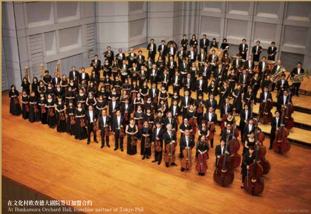
在文化村欧查德大剧院签订加盟合约 At Bunkamura Orchard Hall, franchise partner of Tokyo Phil