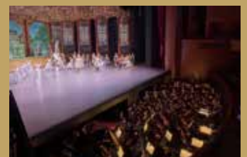
与新国立剧场等地演奏歌剧及芭蕾舞 摄影:新国立剧场《睡美人》©堀田力丸 Opera and ballet performances at New National Theatre, Tokyo and venues across Japan Photo from The Sleeping Beauty at New National Theatre, Tokyo ©Rikimaru Hotta