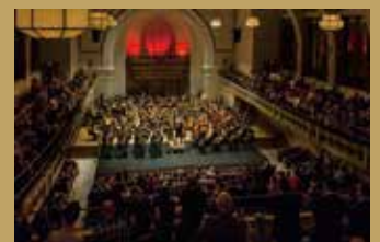
海外公演《创立100周年世界巡回演出2014》 The 100th Anniversary World Tour 2014